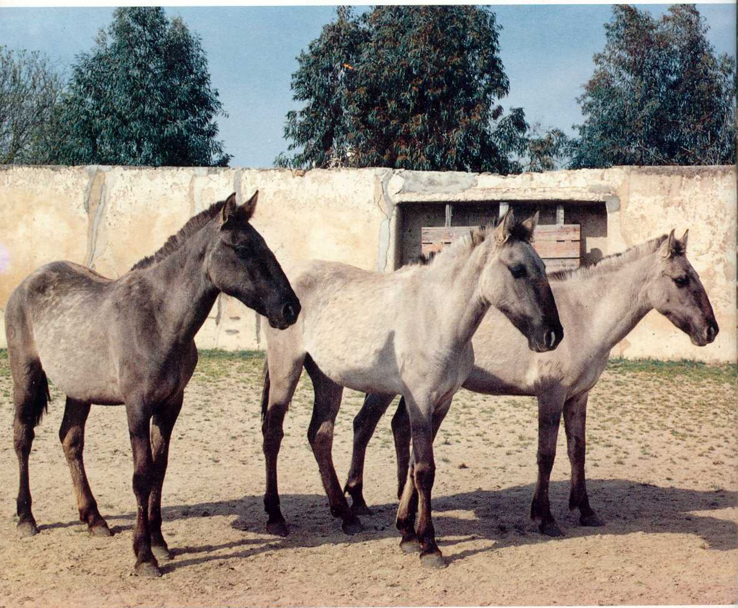
Grupo de éguas de raça Sorraia (Herdade de Fontalva)

É com satisfação que esta Associação tem vindo a ser contactada por pessoas manifestamente interessadas nos desígnios do Cavallo do Sorraia, algumas delas apresentando-se já na qualidade de novos criadores.