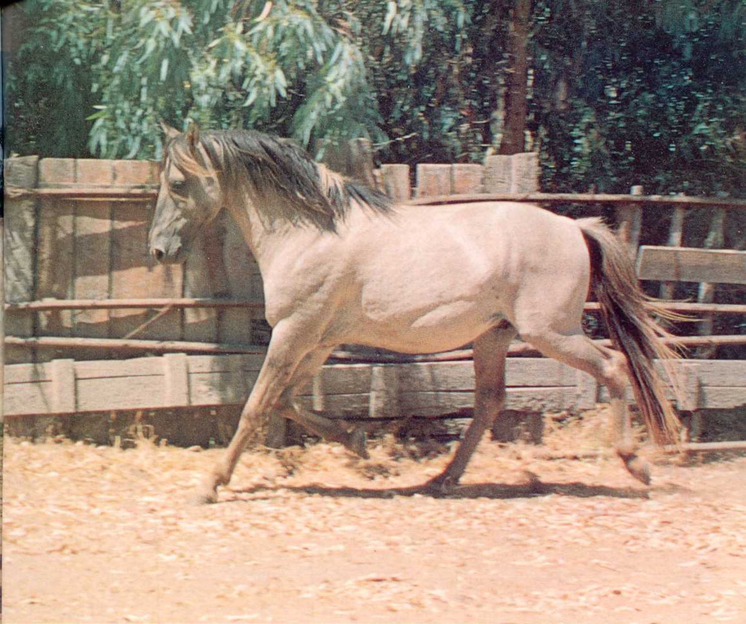
Garanhão de raça Sorraia (Herdade de Fontalva).

da sua aquisição, sendo responsável pela respectiva cria). Desde então a população descendente tem-se mantido completamente fechada, tendo dado origem a algumas subpopulações.